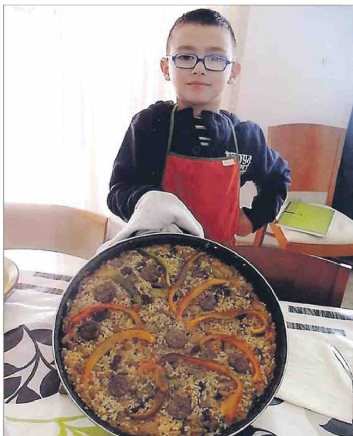
Un dels finalistes del concurs.